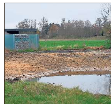
Hier kommt auf Vorschlag der Stadt ein Spielplatz hin.