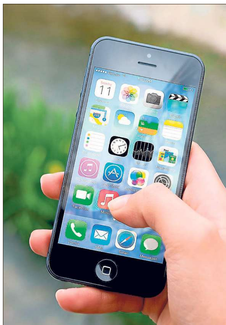
Kostenlosen Zugang zum Internet will die Verwaltung im Stadtzentrum ermöglichen.

Sind die Arbeiten abgeschlossen, will die Verwaltung auch in den Ortsteilen einen drahtlosen Internetzugang ermöglichen. Und zwar in Kooperation mit den dort ansässigen Betrieben sowie zum Beispiel der Einzelhandelsgemeinschaft Kaunitz.