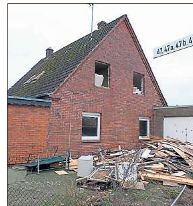
Für den Abriss vorbereitet wird dieses Haus am Strothweg. Die Gebäude auf dem Areal sind kurz nach dem Zweiten Weltkrieg entstanden.